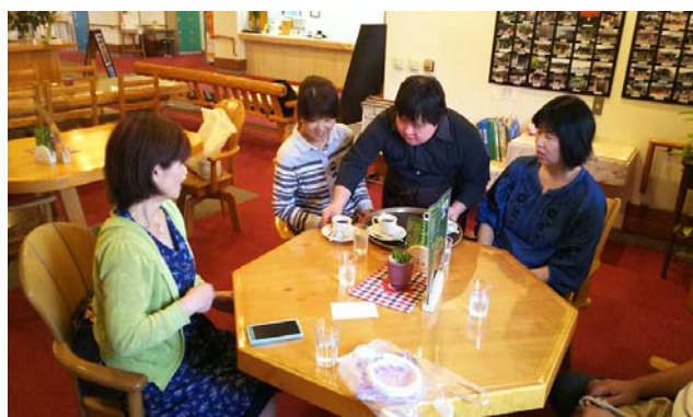
道後友輪荘の喫茶業務