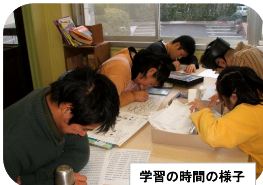
学習の時間の様子