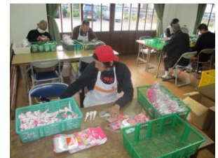
クラッカーの袋詰