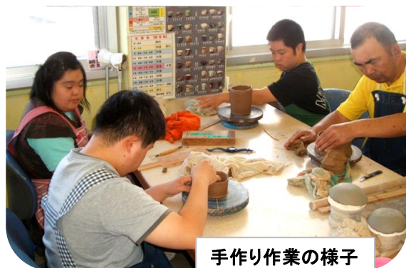
手作り作業の様子